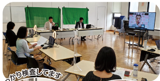
しっかり検査しています

普段見られない商品検査センターの様子やリニューアルした「たべる*たいせつミュージアム」も紹介します。是非参加してみませんか?