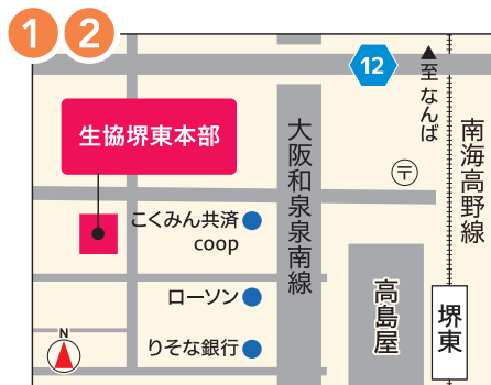
南海高野線「堺東駅」より徒歩約3分 ※駐車場はありません。