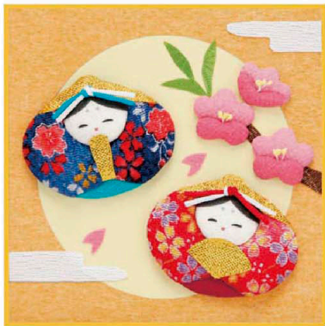
押し絵の図案(和み貝びな)

和み貝びな(10×10cm)を作成し、15cm角の色紙掛けに差し込みます。壁掛けフック・スタンド付きです。