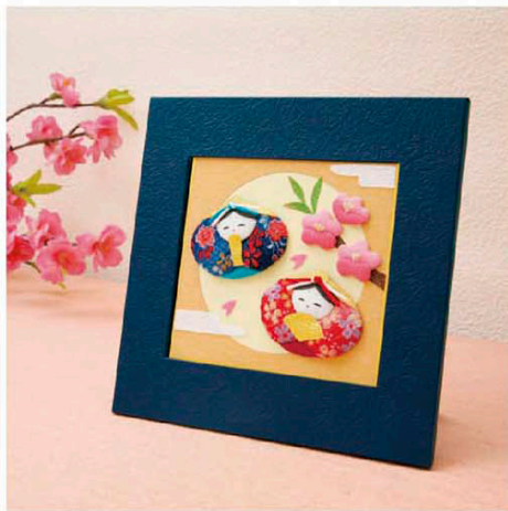
色紙掛けに差し込んだイメージ