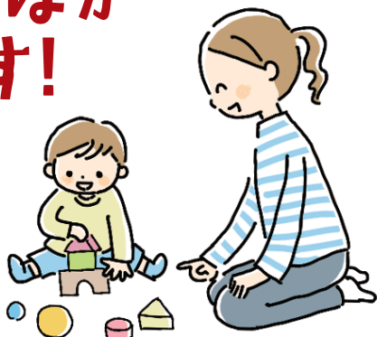
※イラストはイメージです