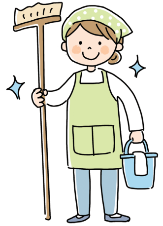
※イラストはイメージです