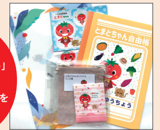
※イメージです。内容は時々変わります。

※ご注意ください。この間アンケート回答時にお知らせいただいたメールアドレス宛にメールが送信できないという事例が起きております。入力時ご確認よろしくお願い申し上げます。