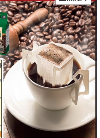
※イラスト・写真はイメージです