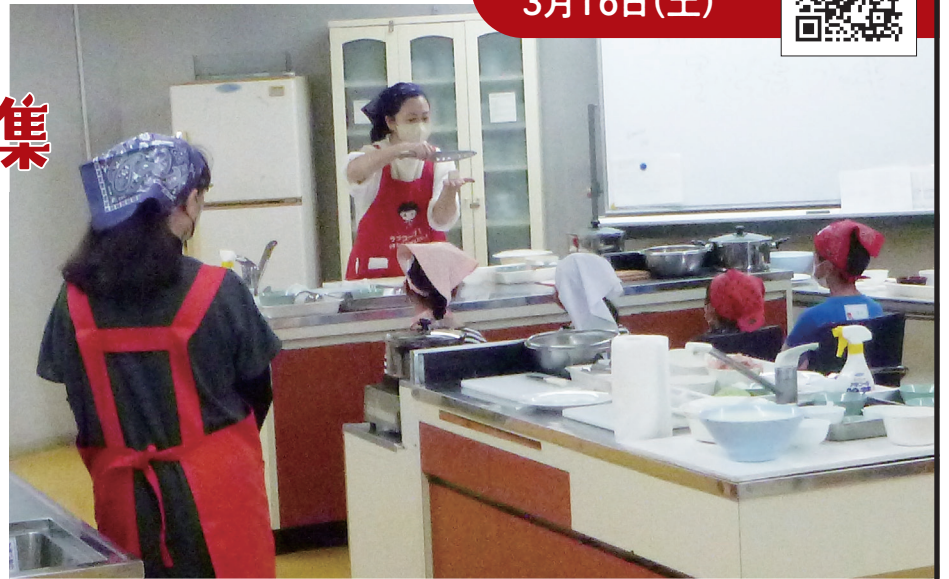
※イラスト・写真はイメージです