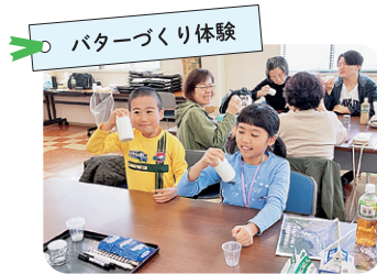
バターづくり体験

5月11日(土) 食 昼・夕 8:30 生協堺東本部 出発 → 12:00 大内山酪農 到着・昼食 → 学習会・バター作り体験・模擬搾乳体験・工場見学 → ミルク村で買い物 → ホテルで夕食交流会 5月12日(日) 食 朝・昼 9:00 ホテル発 → 9:30 御浜ファーム見学 → 昼食 → 熊野本宮大社 → 南紀白浜とれとれ市場 → 19:30 生協堺東本部 着