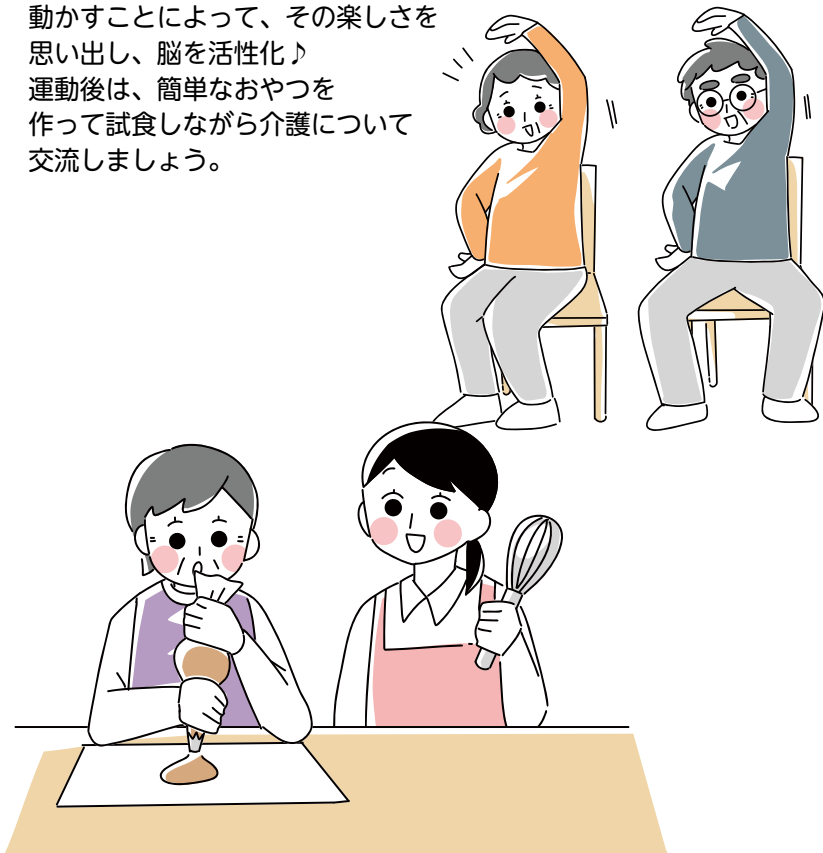
※イラストはイメージです

歌うこと、手足を使って身体を動かすことによって、その楽しさを思い出し、脳を活性化♪ 運動後は、簡単なおやつを作って試食しながら介護について交流しましょう。