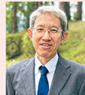
講師:大阪公立大学 農学研究科 小泉 望 教授