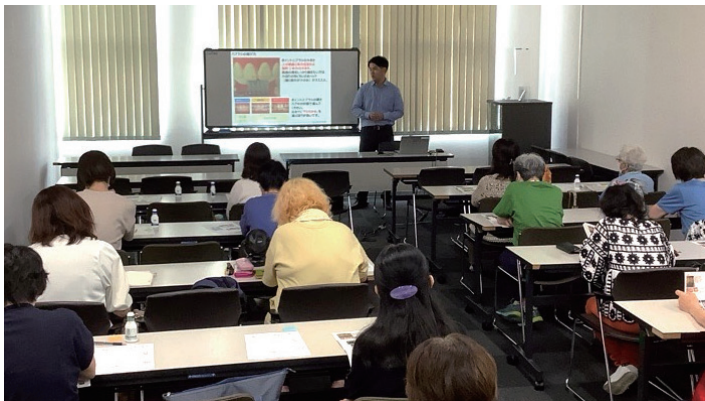
※写真は以前に開催したときのようです