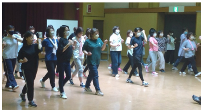
※写真は前回のようすです