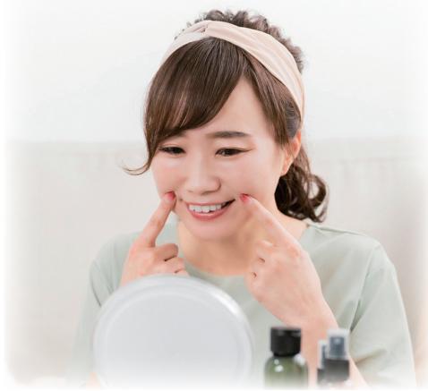
※写真はイメージです