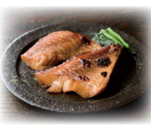
※写真・イラストはイメージです