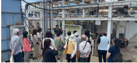
※写真はイメージです 工場見学の様子