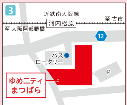
近鉄南大阪線「河内松原駅」より徒歩約2分 ※駐車場あり。(有料)