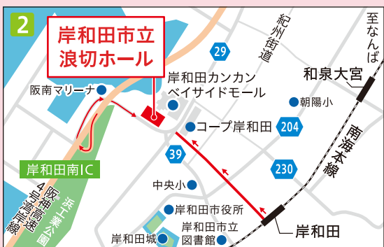
南海本線「岸和田駅」より徒歩約10分 ※駐車場あり。(無料)