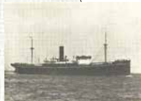
国立国会図書館デジタルコレクションより

1944年8月、国民学校4年生(9歳)の時に疎開のため 対馬丸に乗船し、米国潜水艦の魚雷により沈没。 6日間の漂流の後、奄美大島の無人島に流れ着き、 一命をとりとめる。終戦後は小学校教師となり、 退職後も平和問題に関する 講演活動を続ける。