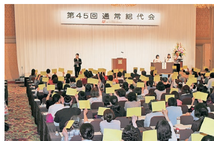
第45回通常総代会のようす(2019年)

総代会とは、組合員の代表(総代)が一堂に会して、生協の活動のまとめ、方針、事業計画、剰余金処分などを議決する、生協の最高の決定機関です。