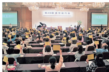
第49回通常総代会のようす(2023年)

総代会とは、組合員の代表(総代)が一堂に会して、生協の活動のまとめ、方針、事業計画、剰余金処分などを議決する、生協の最高の決定機関です。