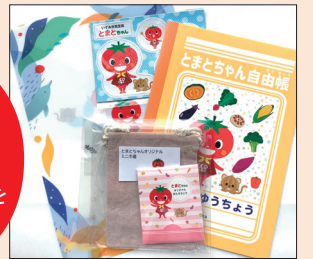
※イメージです。内容は時々変わります。

アンケートにご協力いただき、「見学してみたい」「資料がほしい」にチェックをいただいた方へ「とまとちゃんグッズ」をプレゼントいたします☆