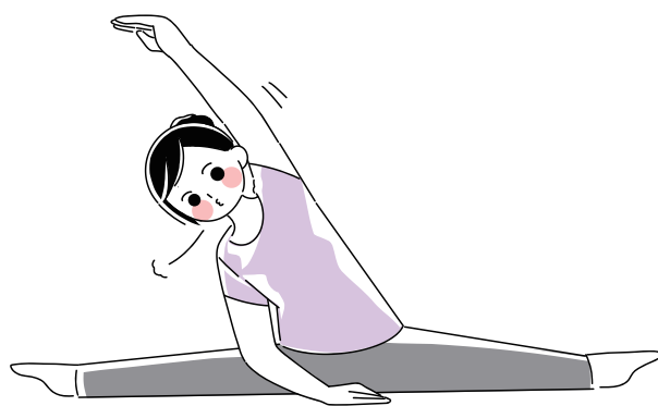
※イラストはイメージです