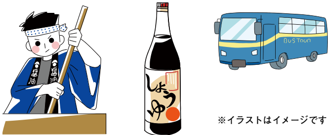
※イラストはイメージです

湯浅醤油へ工場見学に行き、醤油の歴史や製造工程を学習します。その後は、和歌山マリーナシティに行き、各自昼食と自由行動をお楽しみください。