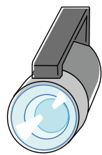
※イラストはイメージです