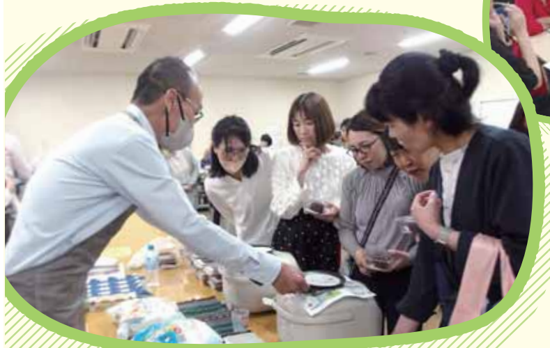
過去の会場の様子